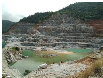
พื้นที่หน้าเหมืองปัจจุบัน

พื้นที่โครงการ ประทานบัตรที่ 21378/15248