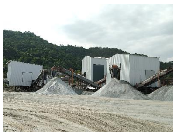
พื้นที่โรงโม่หินของโครงการ