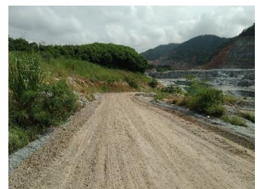
เส้นทางขนส่งแร่ระหว่างหน้าเหมือง-โรงโม่หิน