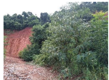
แนวเวนไม่ทำเหมือง