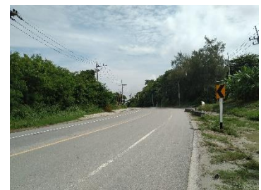
ทางหลวงหมายเลข 3144